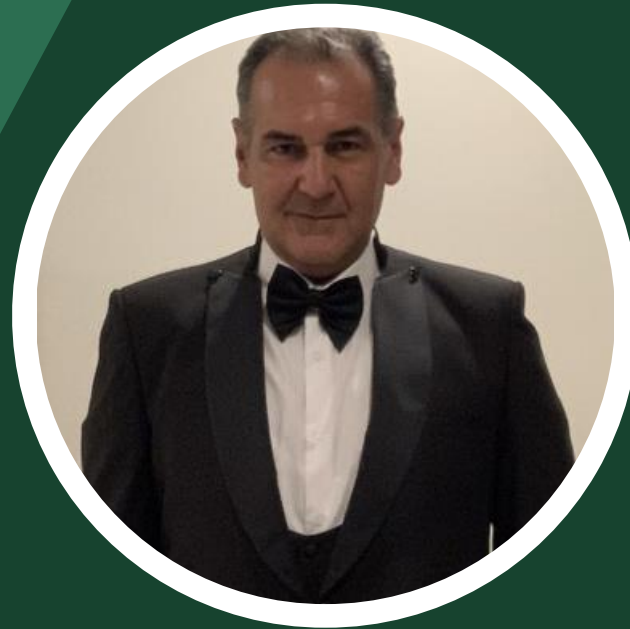
فريقنا المهني الرئيس التنفيذي